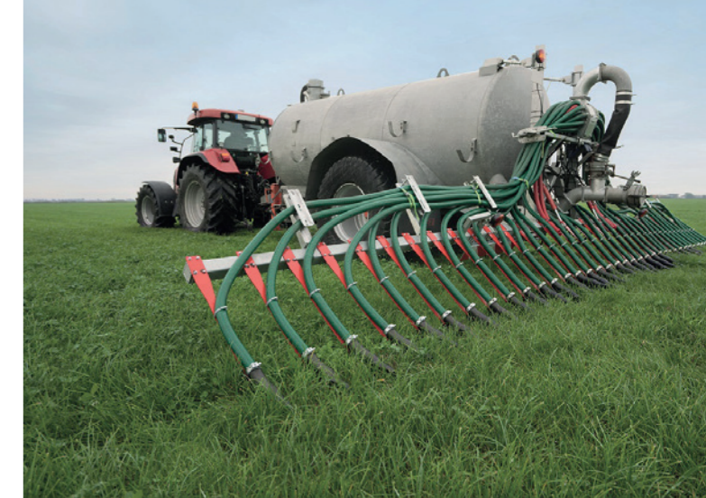
Niezależnie czy mamy pole, uprawy roślin czy użytki zielone, nowa uniwersalna rampa UniSpread firmy Vogelsang jest przystosowana do każdego rodzaju gleby.

Naturalnie nasza rampa jest wyposażona w wydajny rozdzielacz ExaCut, który pewnie rozdrabnia wtrącenia włókniste w gnojowicy do minimalnego rozmiaru. W połączeniu z przemyślanym rozprawdzeniem węży zapewnia wyjątkowo równomierny podział strumienia. Jednocześnie cięta stała zostaną zatrzymane w zintegrowanym tapaczu i nie spowodują zatorów.